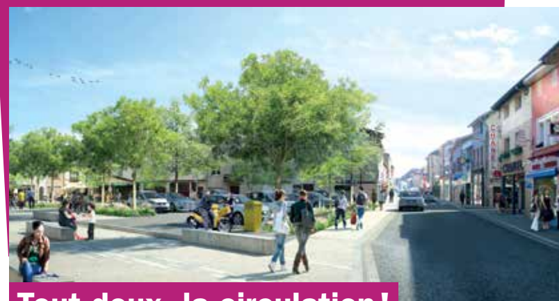
Tout doux, la circulation !

Dans la Grande rue, la largeur de la voie sera réduite pour apaiser la circulation et inciter les véhicules à rouler moins vite. Ainsi, la voirie ne sera plus perçue comme prioritaire car elle fera plus de place aux piétons.