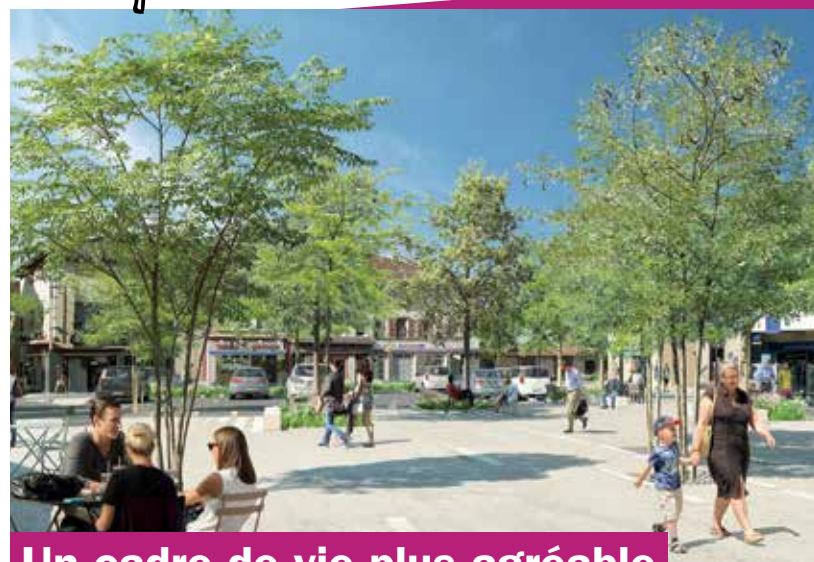
Un cadre de vie plus agréable

Aujourd'hui, la place du 3 septembre sert principalement de parking, les voitures occupant 70 % de l'espace. À l'issue des travaux, elle deviendra une vraie place agréable à vivre et conviviale dont chacun pourra profiter ! Par exemple pour discuter ou flâner sous les arbres, faire une pause sur un banc, boire un verre ou déjeuner en terrasse, regarder ses enfants jouer... La place du 3 septembre sera plus que jamais le cœur de la commune !