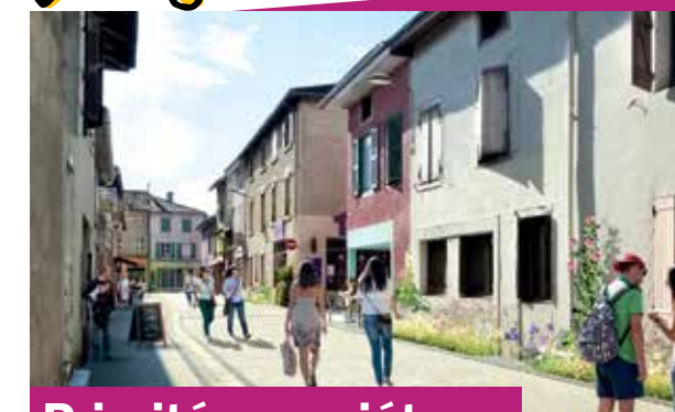
Priorité aux piétons

Les rues du Château et des Tortipieds donneront priorité aux piétons et la vitesse sera limitée à 20 km/h. Piétons et cyclistes pourront ainsi circuler plus sereinement aux abords de la place !